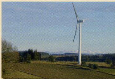
Eolienne et Puy de Sancy

Au service de l'homme depuis des milliers d'années, l'énergie éolienne connaît aujourd'hui une utilisation de plus en plus prégnante qui génère un certain nombre de controverses auprès d'un public souvent sous informé. Et pourtant, l'énergie éolienne outrepassa ses vocations ancestrales pour désormais ralentir et atténuer les perturbations dramatiques liées à l'effet de serre. De tels projets peuvent engendrer des nuisances mais qui sont le plus souvent maîtrisables à condition de mener une étude