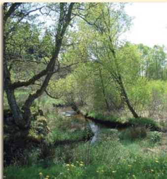
Ruisseau de la Chandouille.

Les communes de Gentioux et de Pigerolles se sont associées en 1972. Ce vaste territoire présente un fort dénivelé entre Pigerolles – le puy Groscher culmine à 831 mètres d'altitude – et le lac de Vassivière (650 mètres d'altitude). Les sources de la Maulde, du Thaurion et de la Chandouille alimentent autant de rivières fort appréciées des pêcheurs de truites. Les promeneurs amateurs de nature et de patrimoine ne sont cependant pas en reste : étangs, moulins et ponts-planches émaillent les cours d'eau qui serpentent entre landes, tourbières et bois, tandis que croix, chapelles et fontaines agrémentent de leur pittoresque présence les chemins creux et les vieux hameaux.